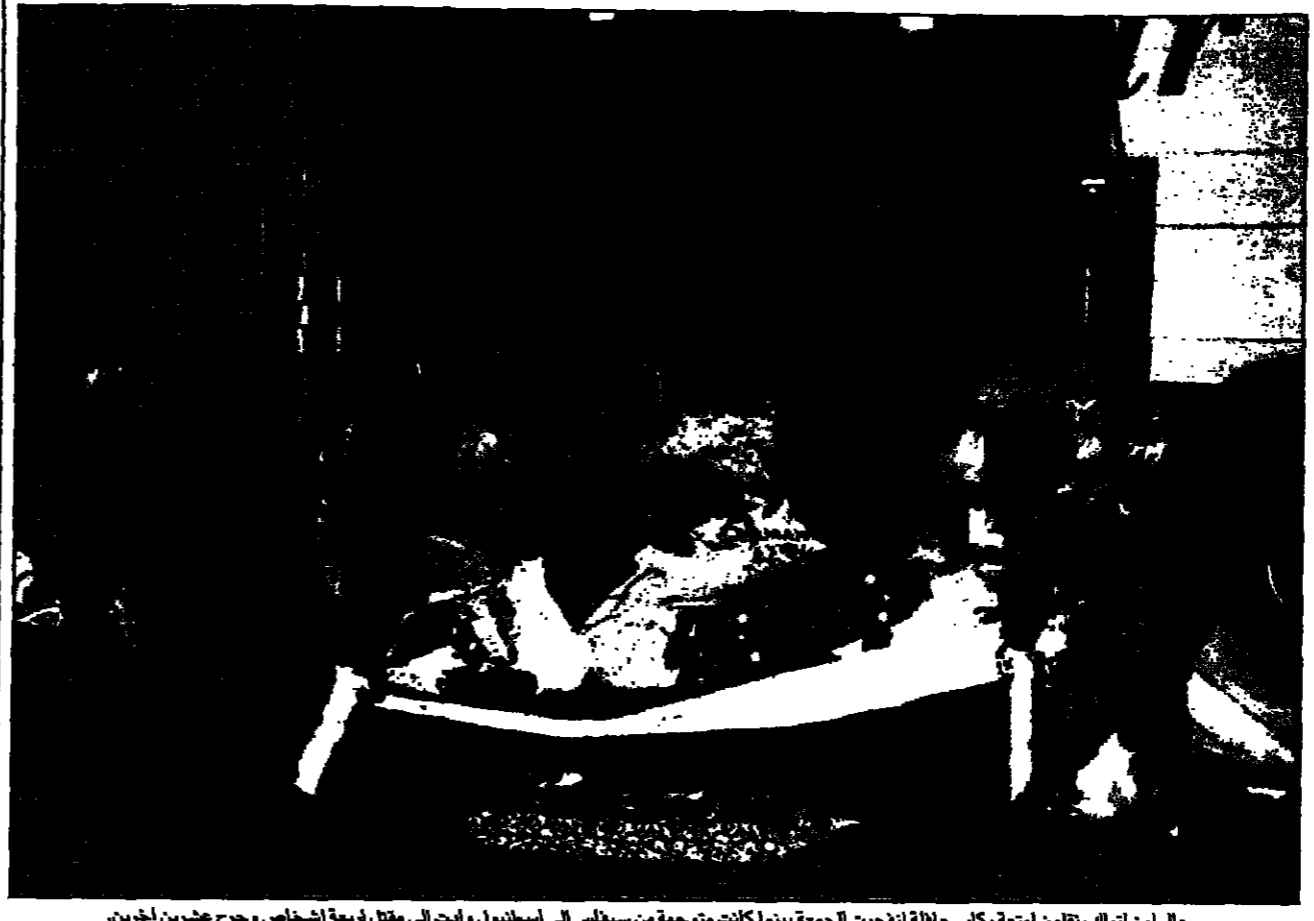
رجال امن اترك يطعن اتمة ركب حافلة تجرعت الجمعة بينما كانت تترجم من سبسي الى اسطنبول وابت الى مطار فرحة اشخاص جرح خريفين اخيرين وكانت المسافلة تمل كراكيا بحسبهم اقرباء لاتخاذ في واتحاد الجمعيات والجموعات الاسلامية، ولم تكن اي جهة مسؤولة عنها من الاعضاء (رويتز)

■ انقرة - رويترز - اذ قد قامت الصحف الجمعة ان زعماء الاحزاب السياسية التركية رفضوا محاولة من الرئيس سليمان ديميريل لتأجيل الانتخابات العامة للبرلمان والتي من المقرر اجراؤها العام المقبل سعيا الى تشكيل حكومة مستقرة. ويجري ديميريل محاولته مع الزعماء الذين اسقطوا بسبب اتهامات بالفساد الاسبق الجاري، ولكنه ما زال يترأس السلطة على رأس حكومة مؤقتة. وقالت صحيفة صبحتورج اليومية ان الرئيس طلب من يلفظ خلال المحادثات التي جرت الخميس لتجديد حكومة مستقرة للانتخابات من 18 نيسان (أبريل) عام 1999 ومحاولة تشكيل حكومة مستقرة. وقالت الصحيفة ان زعماء الاحزاب الاخرى ومن بينهم الزعيم الاسلامي رجائي طغان ورئيس الوزراء السابقة تانسو تشيلير اقروا برفضهم محاولة ديميريل لتأجيل الانتخابات. وقال اجاويد في ختام لقاء مع الرئيس التركي سليمان ديميريل انه يتولى هذه المهمة اذا عرضت عليه على ما ذكرت وكالة انباء الاناتوليه. واعتراف اجاويد بان اختلافات كوسوفو يخلق مشاكل للامانة السياسية يجب ان يرض حزم الوطن الام (زعامة رئيس الوزراء التركي مسعود يولماز) في اطار السيرة الدستورية وحرب الطريق القويم (زعامة رئيس الوزراء السابقة تانسو تشيلير). واضاف ان الاتفاق على حكومة كوسوفو ستؤهل كوسوفو للعودة الى الحياة الديمقراطية وسيتم اجاويد (73 عاما) ان تولى منصب رئيس الوزراء.